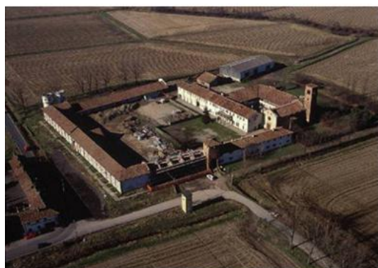
L'Abbazia di Mirasole